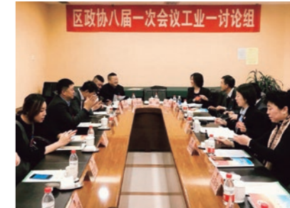
委員会にて(右奥の方)

大連市は2018年3月に「2018年大連市住民とお年寄りのコミュニティーセンター建設の指導標準」を公布し、今後養老サービス体制の強化を進めていく予定です。