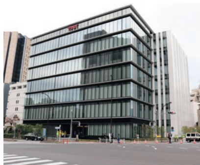
折り返し地点の一つとなったTHK本社前

当日は晴天にも恵まれ、また当社社員19名もランナーとして大会に参加しました。今後も当社の拠点がある地域に密着した活動により、地域住民とのコミュニケーションを深めていく所存です。