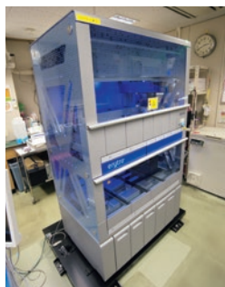
免震装置を設置した 全自動輸血検査装置

人間の体は自分とは違った異物が体内に入り込むと、体から追い出す性質を持っています。輸血検査装置は同じ血液型でも副作用が起きないかを患者さんの血液と混ぜ合わせて事前に不適合をチェックする機械です。当装置は日中5~6時間は稼動、また