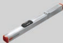
エコミーシリーズ ES