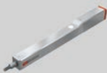
エコミーシリーズ EC