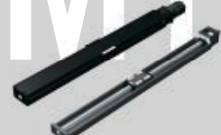
コンパクトシリーズ KR/SKR