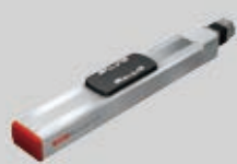
コンパクトシリーズ KRF