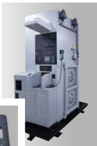
免震モジュール TGS型 採用例 (半導体製造装置)