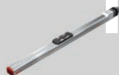
コンパクトシリーズ KSF