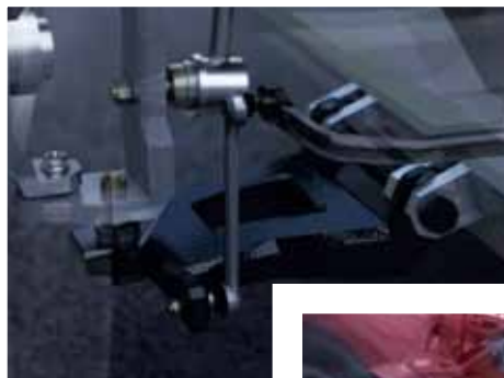
リンクボール採用例

今後も採用数の増加に向けてシナジーの顕在化への取り組みをより加速させていきます。加えて、スタビライザリンクのほか、次世代のステアリング、ブレーキ、サスペンションに加えてインテリアなど自動車の様々な機構において直動関連製品の採用拡大に努め、輸送用機器分野における収益性を向上させていきます。